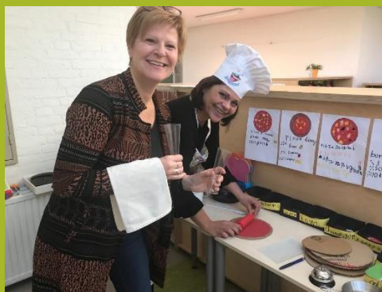
Pizzeria Bon Appetito

Het lopende thema van de groepen 3 is 'de pizzeria'. In de themahoeken zijn 2 pizzeria's verschenen: Pizzeria Bon Appetito (groep 3a) en Pizzeria Mamma Mia (groep 3b). Compleet met door de kinderen zelfgemaakte menukaarten, recepten en een keuken met 'mise-en-place' en een pizza-oven: een leerzame omgeving voor rollen-spel met wisselende rollen zoals de klanten, de pizzabakker, de ober en de bezorger.