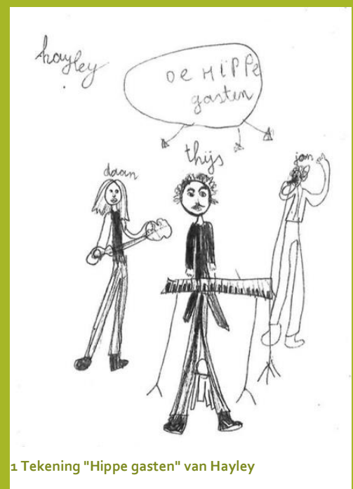
1 Tekening "Hippe gasten" van Hayley

De liedjes met de leuke en uitdagende teksten, gespeeld door een superstrakke band, vielen ook erg goed in de smaak bij de begeleidende ouders en juffen!